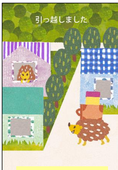
写真を入れられない