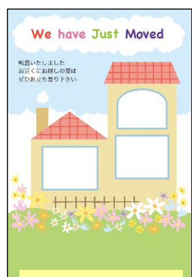
写真を複数入れられる