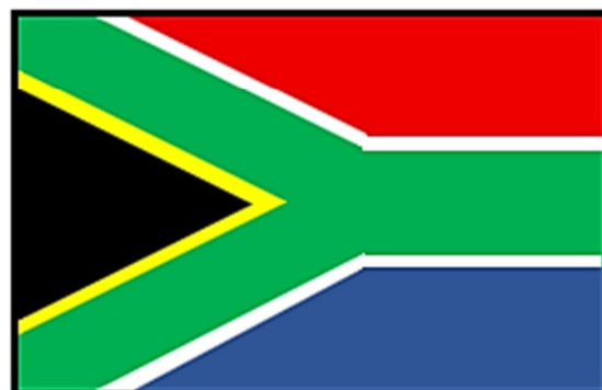
◆南アフリカ共和国